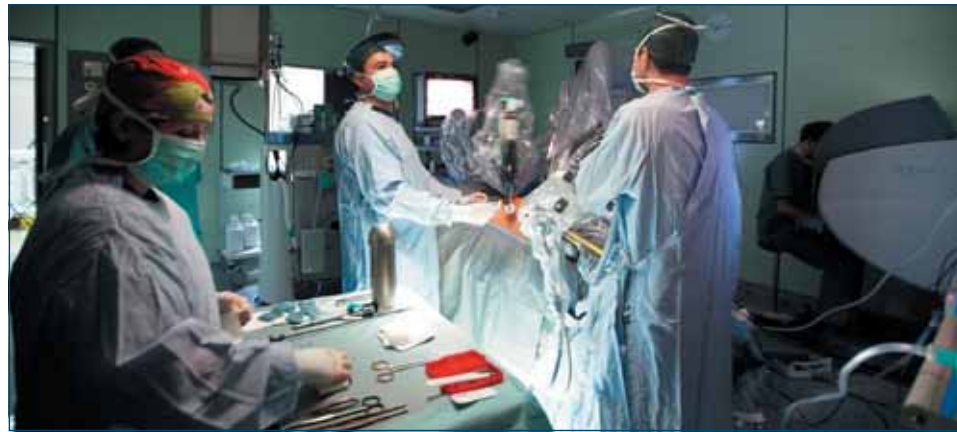
Intervento robotico in sala operatoria a Grosseto